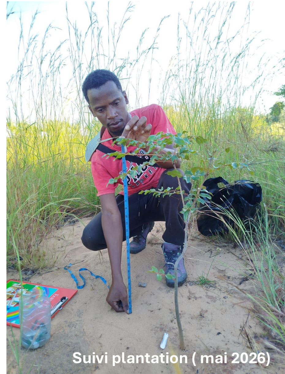
Suivi plantation ( mai 2026)