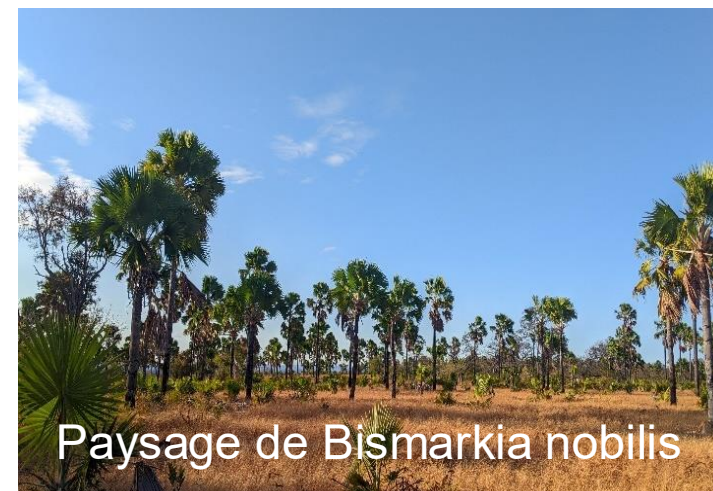
Paysage de Bismarkia nobilis