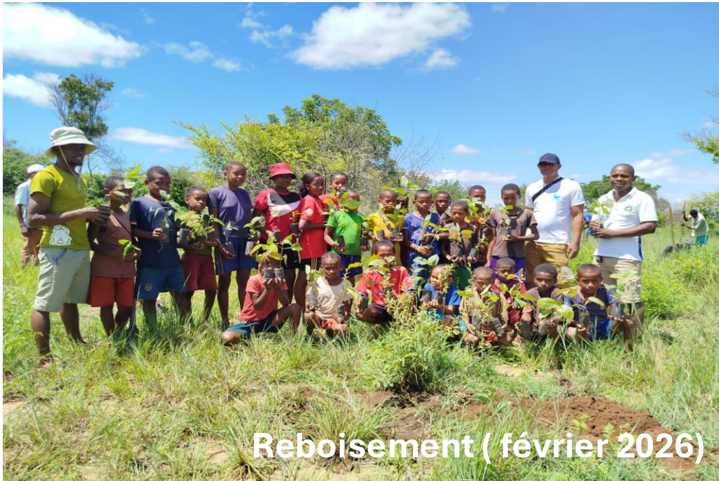
Reboisement ( février 2026)