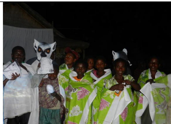
Remise des primes