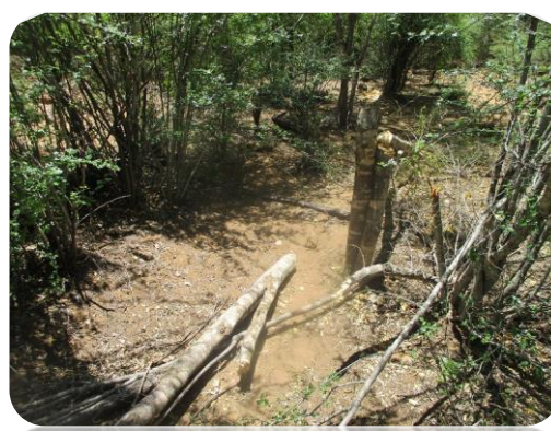
Photo 6 : Arbre coupé proche de piste pour donner ses feuilles au chèvre (Noyau dur )