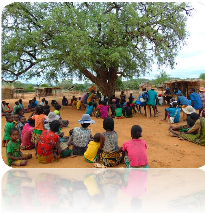
Photo 1 : Réunion et discussion avec les villageois de Dabolavo pour les informer l'importances de protection de lémuriens.

1. Nous les avons informés l'importances de conservation des lémuriens (distributeur des graines et pollinisateur des plusieurs plantes) et des tortues (richesse endémique et ethniques de la région)